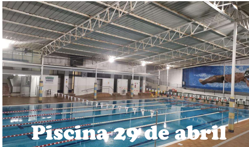
Piscina 29 de abril