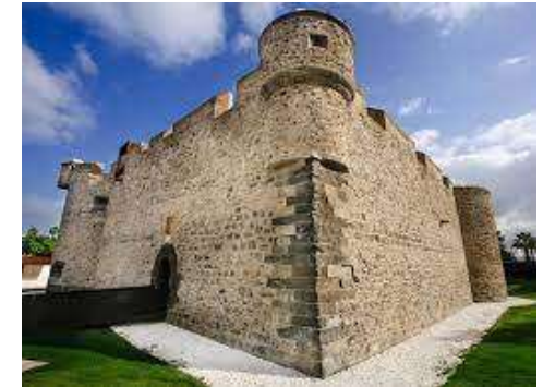
Museo Castillo de la Luz